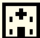
依存症専門 医療機関