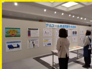
飯豊町町民総合センター

米沢市役所 11月11日(月)～11月15日(金) 飯豊町町民総合センター 11月16日(土)～11月22日(金) 置賜総合支庁(米沢市) 11月18日(月)～11月29日(金)